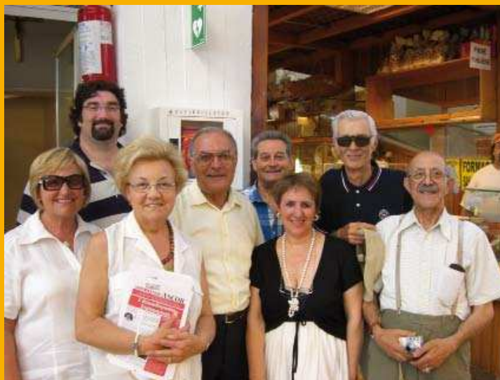
Una parte dei partecipanti all'inaugurazione

l'arrivo di Romagna Soccorso la paziente, ulteriormente stabilizzata, fu trasportata in Ospedale e dopo il necessario periodo di cure, poté tornare dai suoi figli. Da precisare che il DAE nel frattempo restò comunque subito a vigilare sul Mercato Coperto: una coppia di elettrodi ed una piccola scheda di memoria (“card”) di ricambio della stessa marca erano disponibili sull'auto medica, grazie ad una procedura studiata appositamente a Rimini,