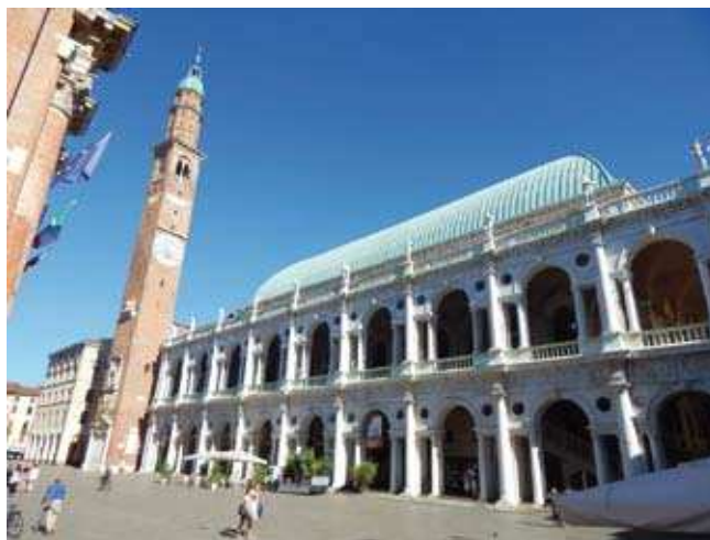
La Basilica Palladiana

S ospesa tra storia e modernità, Vicenza è un gioiello prezioso nel cuore del Veneto. Patrimonio dell'UNESCO dal 1994, offre ai suoi ospiti tesori artistici, storici e culturali inestimabili. Suggestivi intrecci di strade e vicoli caratteristici, capolavori architettonici, ponti, piazze e raffinati palazzi: questa deliziosa cittadina è uno scrigno di bellezze inesauribili per gli amanti della storia e dell'arte. Nota come la città del